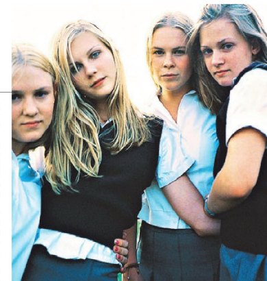
► Sofia Coppola dirigió en 1999 la versión cinematográfica de Las vírgenes suicidas , con Kirsten Dunst de protagonista.

Hay avances. Por ejemplo, las calles están más iluminadas y