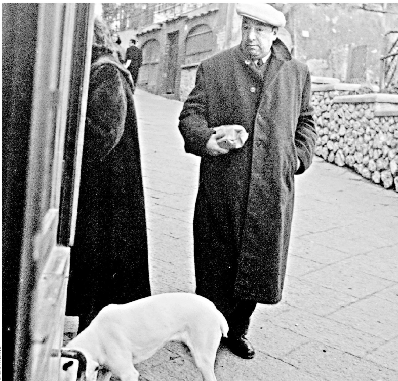
▶ En esta foto del 14 de febrero de 1952 se ve a Pablo Neruda, en ese momento con 47 años, en la isla de Capri, en Italia.

Traductor del poeta chileno, Eisner publica en EEUU Neruda: The Poet's Calling , una biografía de 600 páginas que recoge 15 años de investigación. En ella aborda los aspectos luminosos y sombríos del personaje, como la violación en Ceilán y el abandono de su hija.